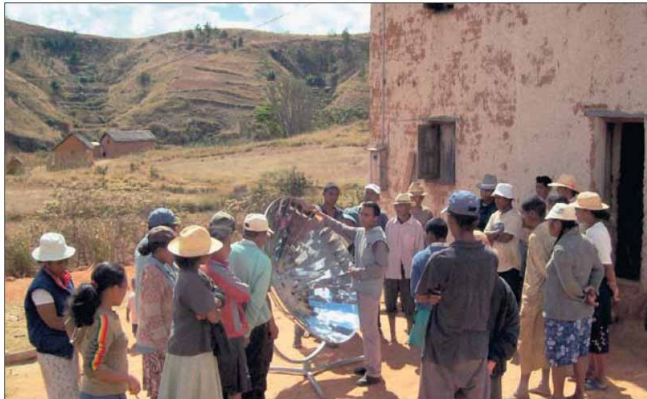
Durch intensive Schulungen werden die Menschen vor Ort mit den Möglichkeiten eines Solarkochers vertraut gemacht.

Madagaskar und die Arbeit des DMVE liegen Scheffler schon lange am Herzen: „Es lohnt sich, dass man sich für dieses Land und seine Menschen engagiert.“ Der Esslinger Verein unterhält auf Madagaskar, einem der ärmsten Länder der Erde, das Berufsausbildungszentrum Soltec, in dem Kinder aus ärmsten Verhältnissen das Rüstzeug für eine gute Zukunft erhalten. Dort lernen sie Metall- und Holzbearbeitung, Nähen und Sticken, Hauswirtschaft und Kochen. Und in ihren Metallwerkstätten stellt die